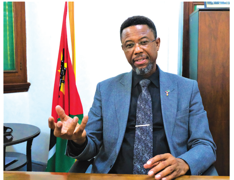
A quantidade de precipitação aumentou bastante

técnico-científico, fazer pesquisas e trazer relatórios do estado do clima, boletins climáticos e outra informação. Falta capacidade técnica de produzir determinado tipo de informação, tal como muitos países o fazem.