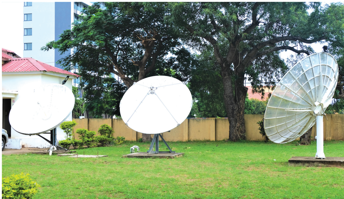
País necessita de mais radares

Sim. São chuvas causadas por diferentes fenómenos que estiveram presentes na mesma altura. Na zona Sul, tínhamos a frente fria. No Centro, um sistema de baixas pressões a provocar chuvas e, na região Norte, uma zona de convergência intertropical. Isso fez com que chovesse ao mesmo tempo nos cerca de 800 mil quilómetros quadrados da área de Moçambique. É algo inédito, razão pela qual, alguns colegas, tiveram que fazer estudos.