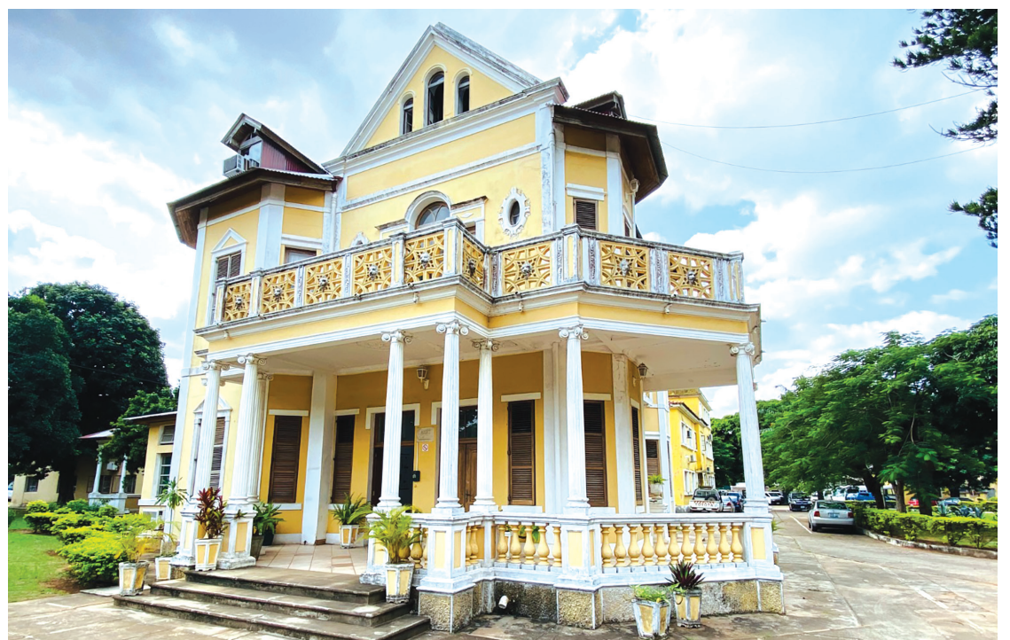
INAM precisa entre 70 e 80 milhões de Dólares

A academia também é chamada a trazer respostas sobre este evento que nunca aconteceu. Cabe também ao INAM, no aspecto